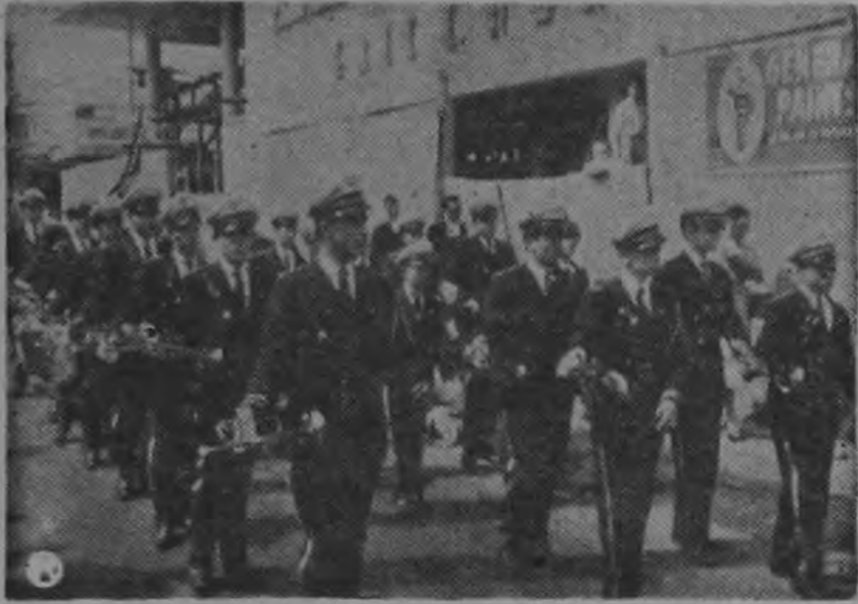
BANDA DEL COLEGIO