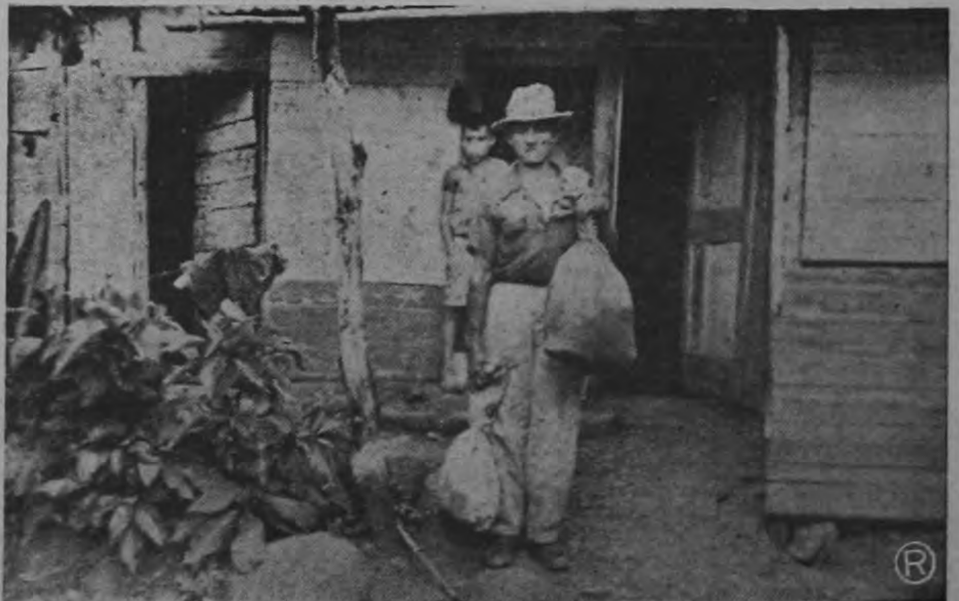
En Tibás hay gentes humanas, que no piensan como el Jefe Político...