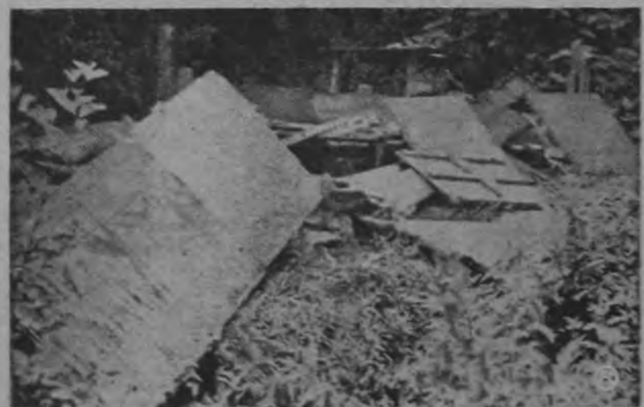
Los perros se comieron "el sancocho"

La Sociedad Interplanetaria heliántica está publicando una nueva revista en la que van a venir vulgarizados pormenores sobre investigaciones concentradas en los problemas de los vuelos en el espacio. El 18 de octubre salió el primer número de "Space-Flight" y se cree que los subsiguientes vayan apareciendo trimestralmente.